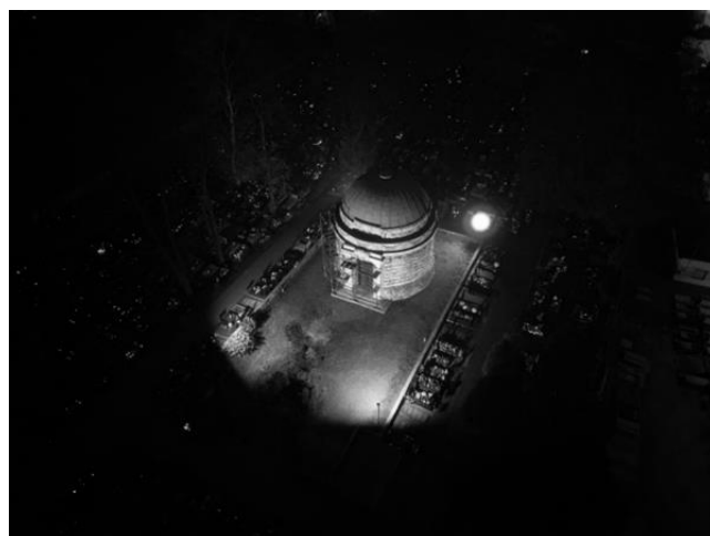
Mauzoleum Dietla zyskało nocną iluminację.