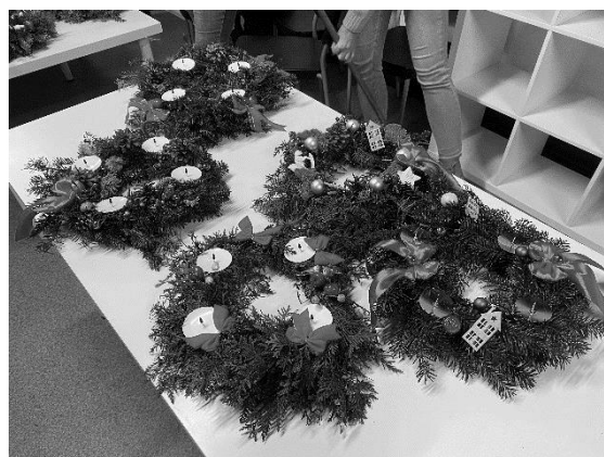
Warsztaty tworzenia wieńców adwentowych na parafii w Szopienicach.