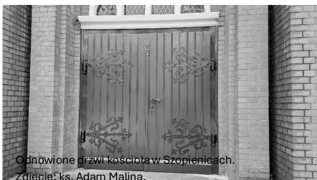
Odnowione drzwi kościoła w Szopienicach.